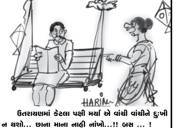
ઉત્તરાયણમાં કેટલા પક્ષી મર્યા એ વાંચી વાંચીને દુ:ખી ન થશો... છાના માના નાહી નાંખો...!! બસ ... !