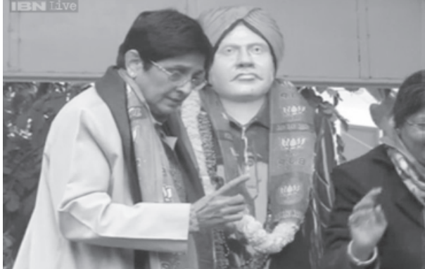
મહત્વ આપ્યું છે. કાર્યક્રમ દરમિયાન બેદીએ કહ્યું હતું કે, દર મહિને દિલ્હીમાં સુરક્ષાની સમીક્ષા કરવામાં

અનેક બેઠકોમાં ભાગ લીધો હતો. થોડાક સમય પહેલા જ પૂર્વ મુખ્યમંત્રી દ્વારા પણ એવી વાત કરવામાં આવી હતી કે, પોલીસની સાથે સંકલનનો અભાવ દેખાઈ રહ્યો છે. તેઓ પોતે આવી પેનલમાં કામ કરી ચુક્યા છે. સરકાર અને પોલીસ તંત્ર સાથે મળીને કામ કરે છે. તાલમેલ તુટવાની સ્થિતિમાં સામાન્ય લોકોને મુશ્કેલીનો સામનો કરવો પડે છે. દિલ્હી વિધાનસભાની ચૂંટણીને લઈને તમામ તૈયારીઓ ચાલી રહી છે ત્યારે આ અંગેની માહિતી સપાટી ઉપર આવી છે. દિલ્હી ચૂંટણીમાં તમામ પક્ષો પોતાની તમામ તાકત લગાવી ચુક્યા છે. ભાજપ અને આમ આદમી પાર્ટી વચ્ચે મુખ્ય સ્પર્ધા છે. દિલ્હીમાં સાતમી કેન્ડુઆરીના દિવસે મતદાન થવાર છે.