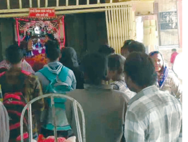
મોડાસાના ઈટાડી ગામે આવેલ પૌરાણિક અંબેમાના દર્શનાર્થે પોષી પૂનમે મોટી સંખ્યામાં અરવલ્લી જિલ્લા સહીત આજુબાજુના જિલ્લામાંથી મોટી સંખ્યામાં માઈ ભક્તો વહેલી સવારથી ઉમટી પડ્યા હતા. મીની અંબાજી તરીકે જિલ્લા સહીત ગુજરાતમાં આ પૌરાણિક મંદિર ભક્તોમાં આસ્થાનું પ્રતીક બન્યું છે. જિલ્લાના સુપ્રસિદ્ધ શામળાજી મંદિરમાં પણ પોષી પૂનમે મોટી સંખ્યામાં શામળિયા ભગવાનના દર્શનાર્થે ભક્તોનું ઘોડાપુર ઉમટ્યું હતું.