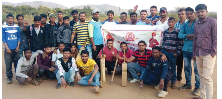
ભિલોડા તાલુકાના ખેરંચા ગામમાં ક્રિકેટ ટુર્નામેન્ટ યોજાઈ

મોડાસા, તા. ૧૮ કલેક્ટરના અધ્યક્ષતામાં ઉચ્ચસ્તરીય બેઠક યોજાઈ હતી. આ બેઠકમાં આગામી ૨૬મી જાન્યુઆરી-૨૦૧૮ પ્રજાસત્તાક પર્વની ઉજવણી મોડાસા ખાતે મ.લા. ગાંધી કોલેજ ખાતે કરવામાં આવનાર છે. આ કાર્યક્રમ સફળતાથી ઉજવાય તે માટે જિલ્લાના દરેક અધિકારીઓને જવાબદારીઓ સોંપવામાં આવી હતી. જેમાં પ્રચાર-પ્રસારની વ્યવસ્થા, સફાઈ વ્યવસ્થા, સ્ટેજ સુશોભન, ફાયરબ્રિગેડ, વીજપુરવઠો, કલાકારોની વ્યવસ્થા, મંડળે સાઉન્ડના કામગીરીનો સમાવેશ થાય છે.