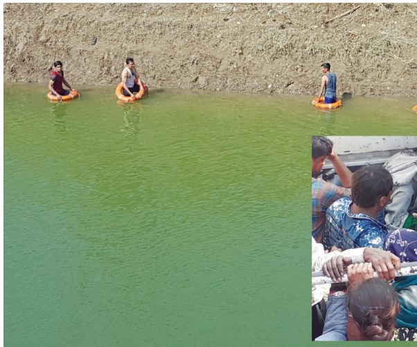
૨૪ કલાક બાદ કેનાલમાંથી મૃતદેહ મળ્યો