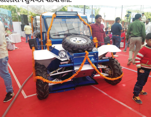
સુધ ગામ ખાતે જળ સુધિકરણ મોબાઈલ વાનનું લોકાર્પણ