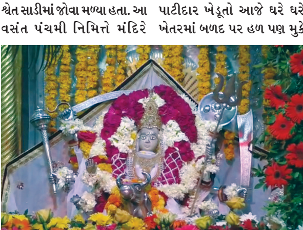
પ્રાતઃકાળ ૪ વાગે ઉમિયા

મહેસાણાના ઊંઝા સ્થિત કડવા પાટીદારોનાં કુળદેવી ઉમિયા માતાજીના મંદિરે આજે સોમવારે વસંત પંચમી નિમિત્તે લોકમેળો ભરાશે. જ્યારે માતાજીને વસંતિયું એટલે કે શ્વેત સાડી પહેરાવી એના ઉપર કેસુડાનો રંગ છાંટવામાં આવ્યો હતો. માતાજીને મહા સુદ-૫ થી ફાગણ વદ-૫ સુધી શ્વેતવસ્ત્રનો શણગાર કરાય છે. જેની આજથી વિશેષ પૂજા કરીને શરૂવાત કરવામાં આવી હતી.