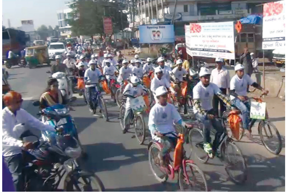
મોડાસામાં ઘી રોડ ટ્રાન્સપોર્ટ સહકારી મંડળી દ્વારા ઈંધણ બચાવો જાગૃતિ સાચકલ રેલી યોજાઈ

થરાદ તાલુકાના જેતડા ચાર રસ્તા પર મહાકાલ સેના દ્વારા પદ્માવત ફિલ્મના વિરોધમાં હાઈવે પર ટ્રાફિક જામ કરી સુગ્રોચ્યાર સાથે પોતાનો રોષ વ્યક્ત કરવામાં આવ્યો હતો. યુવકો દ્વારા મોટાં વાહનના ટાયરોને પેટ્રોલથી સળગાવવામાં આવતા ચારેબાજુ ધુમાડાના ગોટા સાથે અકરાતફરીનો માહોલ ફેલાવા પામ્યો હતો.