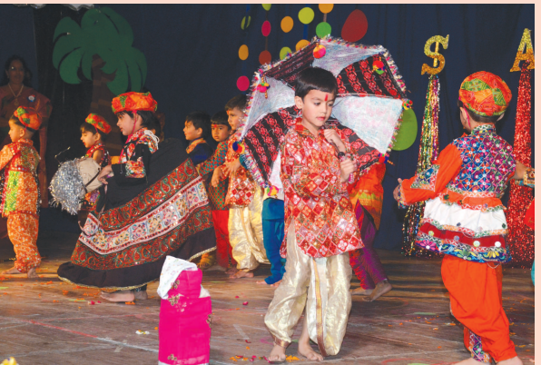
શાળાજીવનના પ્રથમ પગથિયા જેવી પ્રિ-પ્રાયમરી સ્કૂલમાં અવનવી ચીજવસ્તુઓ જોતાં-સમજતાં શીખવા ભુલકાંઓ કોઈ ગીતના તાલે ડાન્સ કરે ત્યારે તે દેશ આંખ માટે ઉત્સવ બની જાય... ગાંધીનગરની જાણીતી પ્રિ-પ્રાયમરી સ્કૂલ 'સ્માર્ટ કીડ્સ'ના વાર્ષિકોત્સવમાં ભુલકાંઓએ એવી સુંદર કૃતિને રજૂ કરી કે વાલીઓ અને આમંત્રિતો રોમાંચિત બની ગયા.