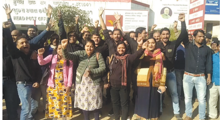
પાલનપુર ખાતે પોસ્ટકર્મીઓએ વિરોધ પ્રદર્શિત કર્યો

દાણા સમયથી ભેદલ પોલીસ કર્મચારીઓની ભદલી થવી જરૂરી છે પોલીસ લોકોનાં હિત માટે રક્ષક તરીકે ગણવામાં આવે છે પરંતુ ધાનેરા માં દારૂ નાં અડાઓ જે તે પરિસ્થિતિ યાહું છે રાત્રીના સમય દરમ્યાન ચોરીનાં બનાવો તેમજ બાઈક ની ઉઠાતરીઓ નાં કેસ અને ચીલ ઝડપ નાં બનાવો વધી રયા છે તેમજ ટ્રાફિક વ્યવસ્થા માં પણ કોઈ પણ જાતની તકેદારી રાખવામાં આવતી નથી કોઈ પણ સ્થળે પોલીસ પોર્ટન્ટ જોવા મળતો નથી અને આવનાર ફરીયાદી ની ફરીયાદ લેવામાં આવતી નથી અને ધક્કે ચડાવવામાં આવે છે તેવું ધાનેરા તાલુકામાં લોક મુખે ચર્ચાઈ રહ્યું છે ફક્ત પોલીસ સ્ટેશન માં બેસી પોતાનાં માનીતાં વ્યક્તિઓ સાથે મોજ કરવામાં મશગુલ રયા છે? સરકારી પગાર ટાઈમ સર મળે છે તથાં અન્ય દરવાજાઓ પણ ખુલ્લા છે તેથી કોઈ પણ જાતની તેઓને ચિતા નથી.