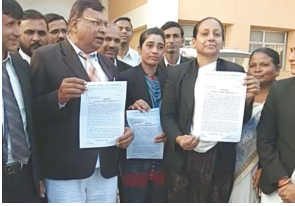
તાલુકાકક્ષાએ જ્યુડિશિયલ ફ.ક. મેજિસ્ટ્રેટ તેમજ ચીફ જ્યુડિશિયલ આર્.સી. પબ્લી. પ્રો સિ કચૂટર ચાલવાની જોગવાઈ છે.

મોડાસા બાર એસોસિએશનનું સત્વરે મદદનીશ સરકારી વકીલોની નિમણૂકની માંગ ગુજરાત ન્યાયતંત્રે મેજિસ્ટ્રેટ કોર્ટ સ્થાપેલ છે. આ સરકારના સહયોગથી રાજ્યના કોર્ટમાં સરકાર તરફ કેસો