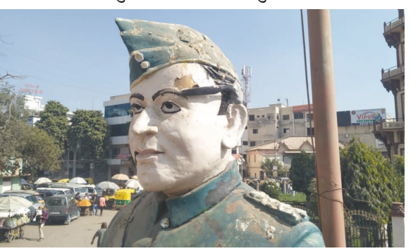
સુભાષચંદ્રબોઝની પ્રતિમા પર પક્ષીઓની હુમલો વચ્ચે તેમના ચરમા ગાયબ થઈ ગયા છે. માત્ર તૂટેલા ચરમાની એક દાંડી જોવા મળી રહી છે. જ્યારે પ્રતિમાના કલરના

પોપડા પણ ઉખરી જતા પ્રતિમા નિસ્તેજ દેખાઈ રહી છે. વર્ષમાં માત્ર એકાદવાર સુભાષબાબુની જન્મ જયંતિએ હરમપદ્મડા બની હારતોરા કરી