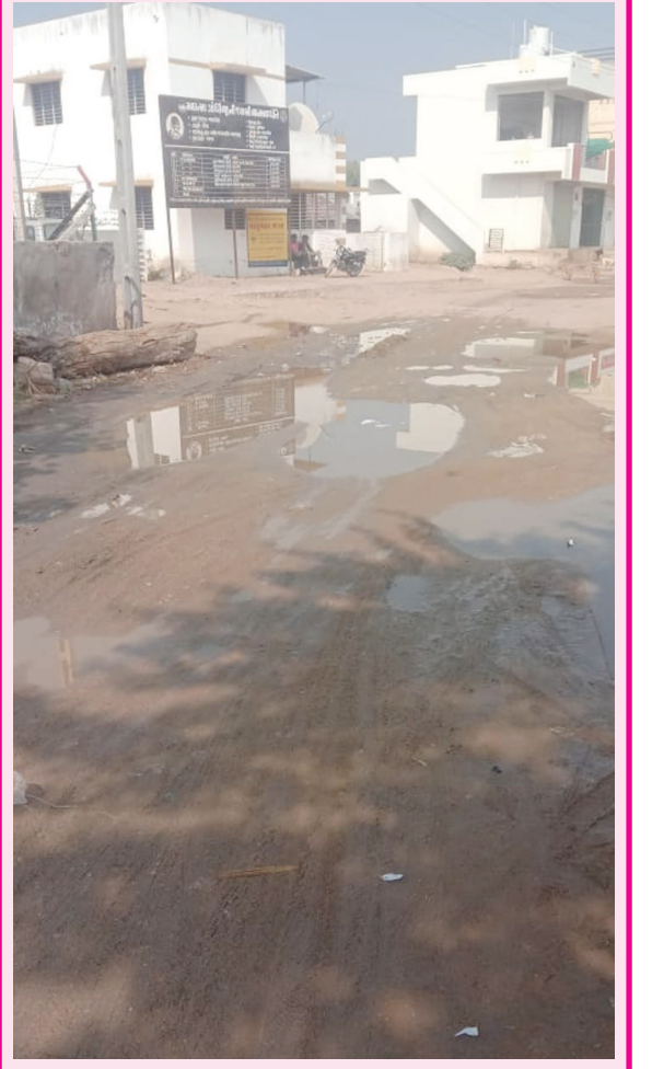
ગામડીયાના જાહેર માર્ગ ઉપર વગર વરસાદે પાણીની રેલમછેલ

સૂત્રોએ જણાવ્યું હતું કે, બનાસકાંઠા જિલ્લા સહિત સમગ્ર ઉત્તર ગુજરાતમાં હાડ થીજવતી ઠંડી પડી રહી છે. ધાનેરા પંથકમાં કડકડતી ઠંડીથી રાહત મેળવવાં સ્થાનિકોએ તાપણાં માટે લાકડાં ગોઠવ્યાં હતા. જે બાદમાં પેટ્રોલ નોંખતાં અચાનક ભડકો થતાં પાંચ લોકો ગંભીર રીતે ઈજાગ્રસ્ત બન્યા હતા. ઈજાગ્રસ્તોમાં એક મહિલા ગંભીર રીતે દાઝી જતાં તેની તબિયત વધુ બગડતાં વધુ સારવાર અર્થે પાલનપુર સિવિલ હોસ્પિટલ ખાતે ખસેડવામાં આવ્યા હતા.