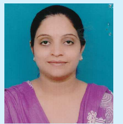
જાહવી ઉમંગ લાયોનેસ ક્લબ