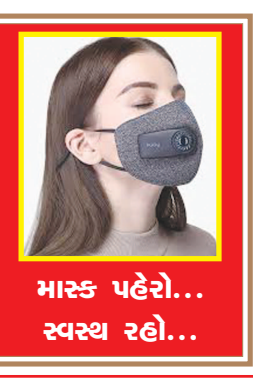
માસ્ક પહેરો... સ્વસ્થ રહો...