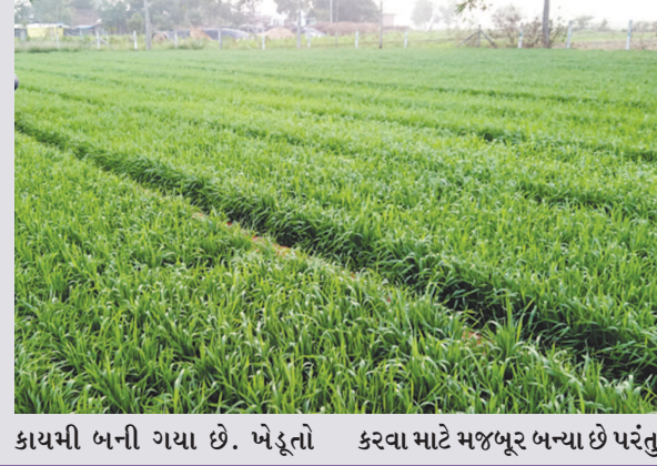
કાયમી બની ગયા છે. ખેડૂતો કરવા માટે મજબૂર બન્યા છે પરંતુ હોવાથી વધુ ઉત્પાદનની આશાઓ શરૂઆતમાં ડિસેમ્બરના આરંભ

સુધી ઠંડીની જમાવટ થઈ ન હતી જેના કારણે આ વર્ષે રવી ખેતીનું વાવેતર ઓછું તો નહીં થાય ને...?? તેવી દહેશત હતી પરંતુ ત્યારબાદ ઠંડીની જમાવટ થઈ અને સિંચાઈ વિભાગ દ્વારા સુજલામ સુફલામ ઉપરાંત સ્થાનિક જળાશયોમાંથી ખેડૂતોને લાભપાંચમ પછી સિંચાઈ માટે પાણી છોડાતાં વાવેતર વિસ્તારમાં ઉછાળો આવ્યો. ઉત્તર ગુજરાતના ૫ જિલ્લામાં બનાસકાંઠા જિલ્લામાં ૪.૮૭ લાખ હેક્ટર જમીનમાં સર્વાધિક વાવેતર થયું છે.