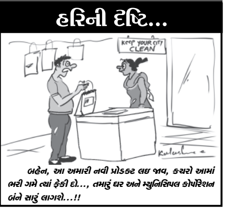
હરિની દષ્ટિ... બહેન, આ સમાચાર નવી પ્રોડક્ટ લઈ જવ, કચરો આમાં ભરી ગમે ત્યાં ફેંકી દો... તમારું ઘર અને મ્યુનિસિપલ કોર્પોરેશન બંને સારું લાગશે...!!