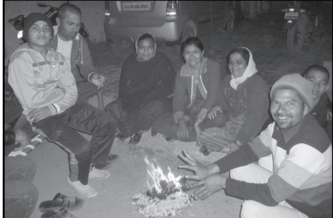
ચિલોડા મોટા ખાતે ઈંડીથી બચવા ઠેર ઠેર તાપણીથી હુકું મેળવતા ગ્રામજનો બરકીલા પવનોથી શીતલહેરો લહેરાઈ રહી છે. સૌ નાગરીકો ઈંડીના સુવચાટા પવનોથી હુંકવાઈ રહ્યા છે. શિયાળાની મોસમમાં ગ્રામ્ય વિસ્તારોમાં ખેતરો લીલાછમ પાકોથી લહેરાય છે. ત્યારે મુલ્લા વિસ્તારોમાં રહેતા ગ્રામ્યજન મોડી સાંજે ઈંડીથી બચવા અનેક ગરમ વસ્ત્રો ઓઢી ખેની અને પશુપાલન વ્યવસાયમાં ધંધા-રોજગારમાં વ્યસ્ત બન્યા છે. ત્યારે ખેતરોમાં રાત્રે પાકને પાણી પિવડાવવા તથા પાકના ભેલાણને બચાવવા રાત્રી જાગરણ કરી રહ્યા છે. ત્યારે ગ્રામજનો મોડી સાંજે ગામની શેરીએ શરીએ ભેગા થઈ સુકા લાકડા તથા છાણમાં એકત્રીત કરી સામુહિક ઈંડીથી બચવા તાપણી સળગાવી રોજબરોજની સામાજિક અને આર્થિક બાબતોની ચર્ચા વિચારણાનો ઠેર ચલાવી તાપણીનો તાપ લઈ રહ્યા છે.