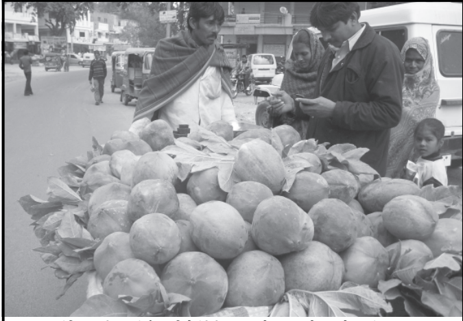
હાલમાં શિયાળાની ઋતુમાં સૌ નાગરિકો ઈંડીથી બચવા માટે ગરમ વસ્ત્રો તથા ખોરાકમાં ગરમ-મસાલાયુક્ત ચીજવસ્તુનો વિશેષ ઉપયોગ કરે છે. પરંતુ શિયાળામાં ફળ તરીકે ઉત્તમ શક્તિવર્ધક તરીકે આંબળા અને પેપેચુંનો વિશેષ લાભકર્તા ગણી શકાય છે. આમ પેપેચું ખાવામાં ખૂબ સ્વાદિષ્ટ અને ગુણકારી છે. પેપેચું ખાવાથી શરીરમાં ગરમીનું સહેજ સિંચન થાય છે. પેપેચું ખાવાથી હાર્ટએટેક તથા ડાયાબીટીસના દર્દીઓ માટે રાહત આપે છે. ચિલોડા પંથકમાં દેશી પેપેચાનું વેચાણ કરતા લારીવાળાના આવન-જાવનથી લોકો પેપેચું મન મુકી ખરીદી કરી રહ્યા છે.

શહેરમાં ૯૬ કી.મી. વિસ્તારમાં ફૂટપાથનું નેટવર્ક ઉભુ કરવામાં આવ્યું છે. જ્યારે ૨૬ કી.મી.ના બાકી કામ માટે પણ મંજુરી આપી દેવાતા આગામી મહીનામાં કામ શરૂ થશે પરંતુ ફૂટપાથ નિર્માણ બાદ સ્વચ્છતા અને જાળવણીના અભાવે આ તોર્નિંગ બર્ચનો કોઈ હેતુ સરતો નથી. કેટલાક ઠેકાણે સેક્ટરોમાં ઘુસવાના શોર્ટકટ્સ માટે ફૂટપાથમાં ગાબડા પાડવામાં આવ્યા છે. વાહનો દોડાવાતા ફૂટપાથ બેસી ગઈ છે. આ ઉપરાંત વોક વે આસપાસ કચરાના બજાર જતા હવે ફૂટપાથ પર વોકીંગ માટે જવાનું પણ આમ નાગરિકો માટે મુશ્કેલ બની રહ્યું છે. ફૂટપાથ પર નુકેલા બ્લોક પાથ વોકીંગ કરનારા સિનિયર સિટીઝન્સ માટે