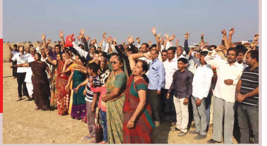
લોકોએ આ પ્રોજેક્ટને એનઓસી આપવાની કાર્યવાહી સામે વિરોધ

ગાબટ તથા મહીસાગર જિલ્લાની સરહદોમાં કુદરતી રીતે હરિયાળી રહે છે. આ ગામોમાં વસતા હજારો લોકો પશુપાલન તથા ખેતી સાથે જોડાયેલા છે. આ વિસ્તારમાં ધી