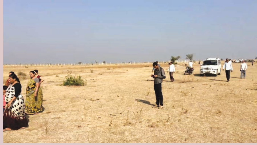
કેમિકલ કચરો ઠાલવવાનો પ્રોજેક્ટ સ્થાપવામાં આવનાર હોઈ બાયડ

મોડાસા, તા. ૫ અરવલ્લી જિલ્લાના બાયડ તાલુકા તથા મહીસાગર જિલ્લાની સરહદે સીમલીયા વિસ્તારમાં ઝેરી