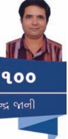
ગાંધી ૧૦૦ ડો. રાજેન્દ્ર બખી