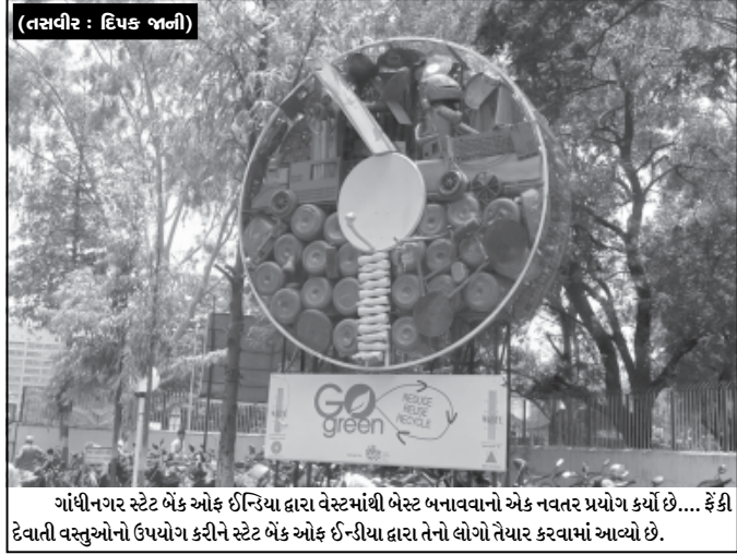
ગાંધીનગર સ્ટેટ બેંક ઓફ ઈન્ડિયા દ્વારા વેસ્ટમાંથી બેસ્ટ બનાવવાનો એક નવતર પ્રયોગ કર્યો છે... જે કી દેવાની વસ્તુઓનો ઉપયોગ કરીને સ્ટેટ બેંક ઓફ ઈન્ડિયા દ્વારા તેનો લોગો તૈયાર કરવામાં આવ્યો છે.