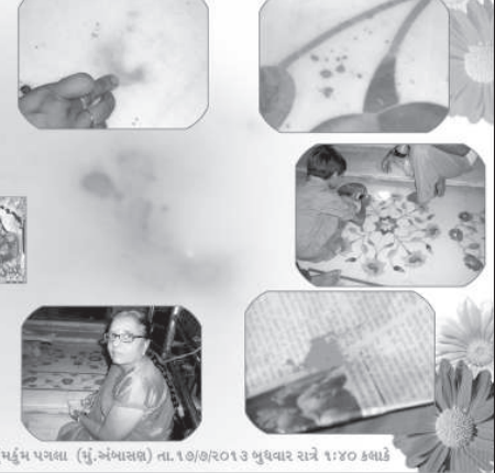
શ્રદ્ધાને પુરાવાની જરૂર હતી પરંતુ પ્રત્યેક બાબતને વેશાનિક દૈષ્ટિકોણથી મુલવવા માનવ જીવન સામે પ્રકાશમાં આવતા અનેક કિસ્સાઓ કુદરત પ્રત્યેની શ્રદ્ધા અને ભક્તિભાવને મજબૂત ચોકસ બનાવે છે. મહેસાણા જિલ્લાના અંબાસણ ગામમાં સ્થિત અન્નપૂર્ણા મંદિરમાં ગત બુધવારની મોડીરાતે ભાવિકોની શ્રદ્ધાને અનોખો પરચો મળ્યો હતો. મંદિરના ચોકીદાર સહીત ટ્રસ્ટી મંડળના સભ્યોના જણાવ્યા મુજબ મોડી રાત્રીના મંદિર પાસે સ્થિત માતાજીના રૂમમાં ચાંદીની મૂર્તિમાંથી અચાનક પ્રકાશ પથરાયો હતો. આંખ આંજી દે તેવા પ્રકાશ વચ્ચે મંદિરના દાર સુધી પથરાયેલા અજવાળામાં 'શક્તિ' ના દર્શન થયા હતા. પળવારમાં જ આંખ સામે કંકુ પગલાના દર્શન થયા હતા. આ જોઈ હતપ્રત ચોકીદારે પુજારીને જાણ કરી હતી. પુજારીએ માતાજીના દર્શન થયા હોવાની ધન્યતા અનુભવી રાત્રીના ૨ વાગે માતાજીની પૂજા-અર્ચના અને આરતી કરી હતી અને મંદિરના ટ્રસ્ટી મંડળના સભ્યોને જાણ કરી હતી. જ્યારે ટ્રસ્ટી મંડળના સભ્યો પિનાકીન જાની, હરેશ જાની, દિપક જાનીએ પણ માતાજીની આરતી કરી દર્શનનો લાભ લીધો હતો.

ગાંધીનગર, તા. ૧૯ શાળાઓમાં મુખ્ય શિક્ષકોની ભરતીને અનુલક્ષી એચ. ટાટની પરીક્ષા લેવામાં આવનાર છે. રાજ્ય પરીક્ષા બોર્ડ દ્વારા ગત વર્ષે દરમિયાન પણ ભરતીને અનુલક્ષી પરીક્ષાનું આયોજન કરવામાં આવ્યું હતું. જ્યારે ગત વર્ષ દરમિયાન પણ ૫ હજાર શિક્ષકોની ભરતી કરવામાં આવી હતી. આ વર્ષે પણ ૬ હજાર શિક્ષકોની ભરતી થશે. જો કે આ પૈકી ૫૦ ટકા સીધી ભરતી અવ્યવે તેમજ અન્યને એચ. ટાટની પરીક્ષા અને સિનિયોરીટી આધારિત ભરતી કરાશે.