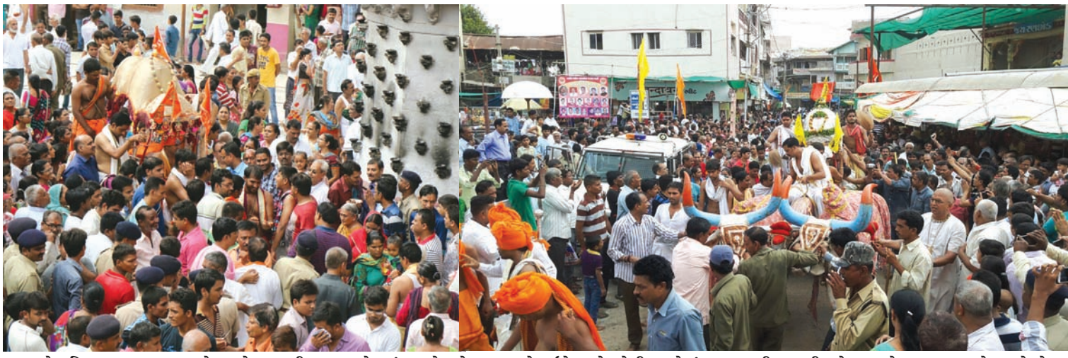
ખેડા જિલ્લાના યાત્રાધામ ઠાકર ખાતે ૨૪૪મી રથયાત્રાનો પ્રારંભ થયો હતો. રથયાત્રાને લઈને આજે વહેલી સવારે મંગળા આરતી બાદ શ્રીજીને બાળભોગ, શણગાર ભોગ અને ગોવાળ ભોગ સહિતના ભોગો ધરાવવામાં આવ્યા હતા. ત્યારબાદ નીજ મંદિર પુલ્યા બાદ આરતી કરી મંદિરના સેવકોએ ભગવાનના રથની પૂજા કરી હતી અને ત્યારબાદ મંદિરની પ્રદક્ષિણા કરી ગોપાલલાલજી રથમાં બિરાજમાન થઈને બહાર આવ્યા હતા. ત્યારે ઉપસ્થિત શ્રદ્ધાળુઓએ જય રણછોડ... માખણચોરના નાદથી વાતાવરણને ગુંજવી મૂક્યું હતું.