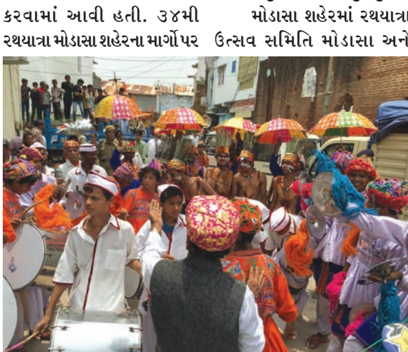
ખેડાસા માર્ગ પર ભાવિ ભક્તોએ રથયાત્રામાં જોડાયેલા ભક્તજનો માટે લિંબુ-શરબત, ચા-પાણી, પાણીના પાઉચ, ગુલુકોઝ બીસ્કીટની વ્યવસ્થા