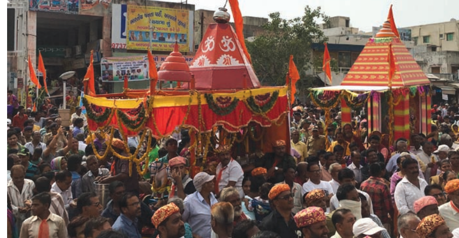
રથયાત્રા માર્ગ પર ભાવિ ભક્તોએ રથયાત્રામાં જોડાયેલા ભક્તજનો માટે લિંબુ-શરબત, ચા-પાણી, પાણીના પાઉચ, ગુલુકોઝ બીસ્કીટની વ્યવસ્થા

દબદબાભેર નીકળી હતી. ભગવાન બાલકદાસજીના નિજ મંદિરેથી નીકળેલી રથયાત્રામાં ભજન મંડળીઓ, બેન્ડવાજા, ઢોલી, પાંચ રાજ્યના લોક સાંસ્કૃતિક નૃત્યો સાથે તેમજ વિવિધ સમાજને ઉપદેશ આપતા ટેબલોએ આગવુ આકર્ષણ જમાવ્યું હતું. નિજમંદિરેથી નિયત સમયે નીકળેલી રથયાત્રામાં આશરે ૨.૫ કિલોમીટર સુધી લાંબી રથયાત્રામાં અરવલ્લી જિલ્લાના ભક્તજનો અને અગ્રણીઓ જોડાયા હતા. મુસ્લિમ સમાજના બિરાદરોએ ચાર રસ્તા પહોંચેલી શોભાયાત્રાનું ભવ્ય સ્વાગત કર્યું ત્યારે કોમી-એકતાના દર્શન થયા હતા. ઉપસ્થિત હાજર શ્રદ્ધાળુઓ જગન્નાથના નાદ સાથે જયકારો બોલાવતા ઝુમતા નજરે પડતા હતા. જિલ્લા કલેક્ટર