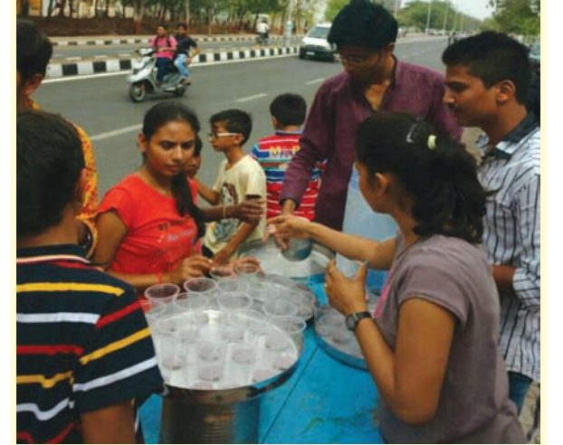
‘યુવા અનસ્ટોપેબલ’ના નામથી ગાંધીનગર શહેરમાં વિવિધ સેવાકીય પ્રવૃત્તિઓ કરતા યુવાઓના જૂથ દ્વારા રથયાત્રામાં પણ સેવાકાર્ય બજાવવામાં આવ્યું હતું. ૩ નંબરના રોડ ઉપર ૭/૨ પાસે આ યુવાઓએ રથયાત્રાના માર્ગમાં મસાલા સોડાનું વિતરણ ગોઠવ્યું હતું અને રથયાત્રામાં જોડાયેલા ભાવિકોને તેનો લાભ આપ્યો હતો.