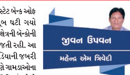
જ્યોતિ ઉપવન મહેન્દ્ર એમ ત્રિવેદી