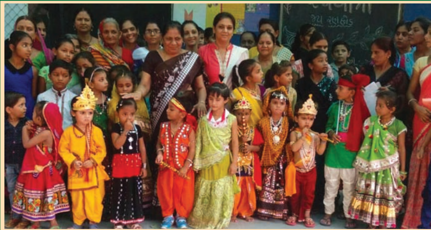
સેક્ટર-૨ ઠામ કાર્યરત સ્વામી વિવેકાનંદ સ્કૂલ દ્વારા રથયાત્રા પર્વની ઉજવણી બુધવારે કરવામાં આવી ત્યારે બાળકોએ કૃષ્ણ-ગોપ-ગોપીઓની વેશભૂષા ધરીને સુંદર દર્શનો સર્જન કર્યું હતું.