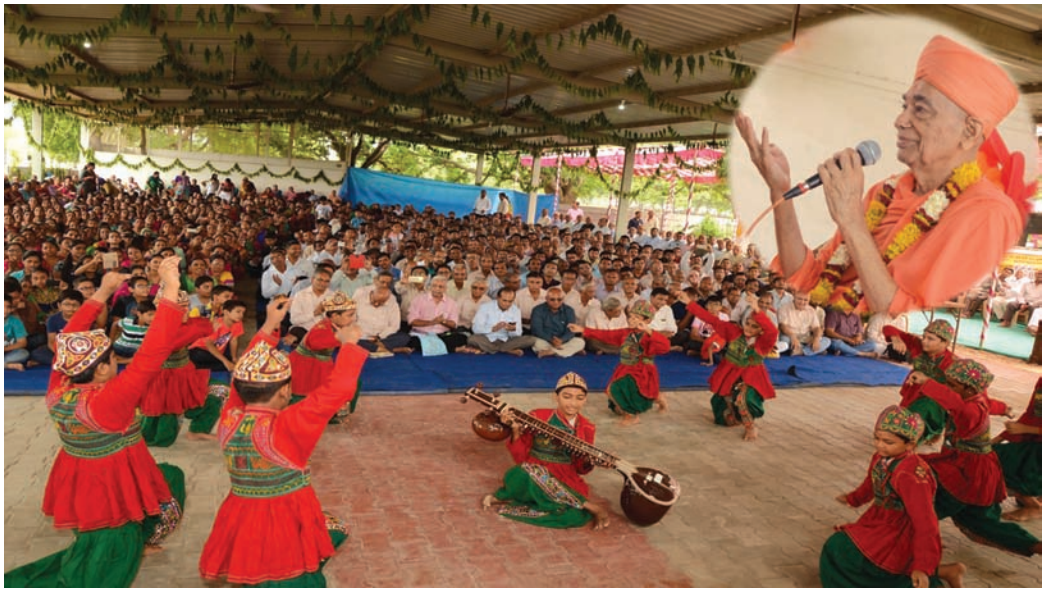
મહાનુભાવો ઉપસ્થિત રહ્યા હતા. આ પ્રસંગે બાળકો, યુવાનો દ્વારા વિવિધ સાંસ્કૃતિક કાર્યક્રમો રજૂ કરવામાં આવ્યા હતા. આ પ્રસંગે સેવાના ભાગરૂપે લાકરોડા પ્રાથમિક શાળાના તમામ વિદ્યાર્થીઓને વિનામૂલ્યે બે હજાર નંગ ચોપડાનું વિતરણ કરવામાં આવ્યું હતું.