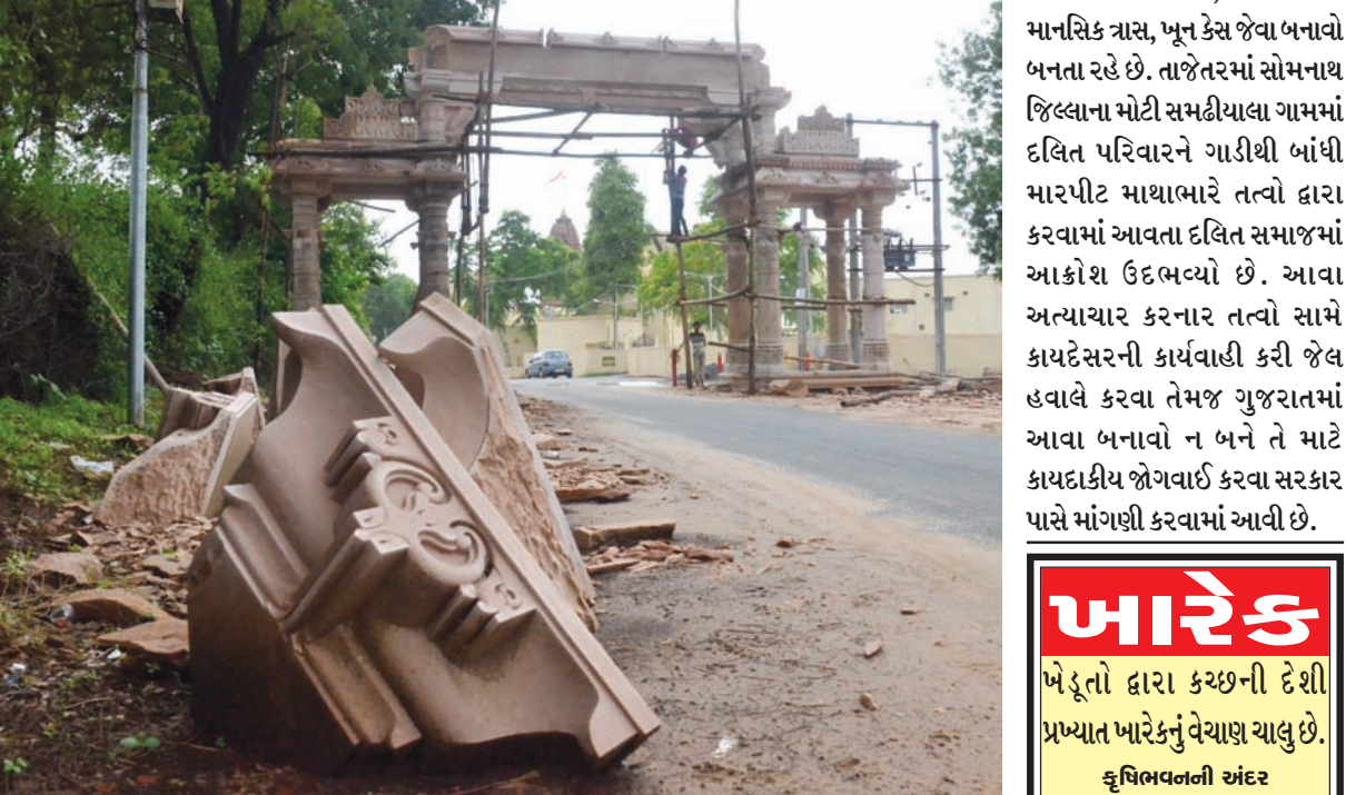
પ્રવેશ દાર : પાટનગરના પાદરે પૌરાણિક મંદિર ધોળેશ્વર મહાદેવના પ્રવેશ સ્થાન પર ભવ્ય પ્રવેશદાર નિર્માણ થઈ રહ્યો છે. કલાત્મક કોતરણીવાળા પ્રવેશદારથી પૌરાણિક મંદિરના આકર્ષણમાં વધારો થશે.

ગાંધીનગર, તા. ૧૫ બાલવા ગામ સ્થિત શ્રી સ્વામિનારાયણ હાઈસ્કૂલ ખાતે ઈકો કલબ અંતર્ગત વૃક્ષારોપણના કાર્યક્રમનું આયોજન કરવામાં આવ્યું હતું. જેમાં સરગવો, બોરસલ્લી, સીતાફળ, જામફળ, કપોત, લીમડી જેવા વૃક્ષો અને વિવિધ જાતના ફૂલછોડ રોપવામાં આવ્યા હતા. ત્યારબાદ વૃક્ષોનું રક્ષણ થાય તે માટે 'સુરક્ષા કલ્પ' પાંજરા લગાવવામાં આવ્યા હતા. વૃક્ષારોપણ કાર્ય વિદ્યાર્થીઓએ ખૂબ જ ખંત અને ઉત્સાહથી કર્યું હતું. તેમજ રોપેલ છોડની માવજત કરવાની જવાબદારી પણ સ્વીકારી હતી. આ કાર્યક્રમ દરમિયાન ઈકો