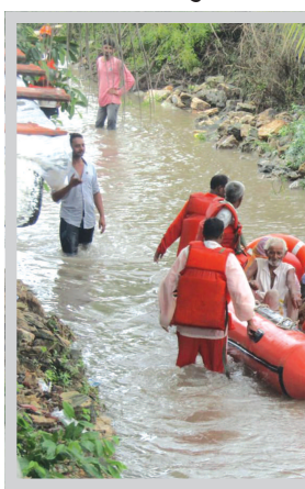
કલાકમાં ગુજરાત રાજ્યમાં સૌરાષ્ટ્ર અને દક્ષિણ ગુજરાતના પંથકોમાં મેઘરાજાએ અનરાધાર