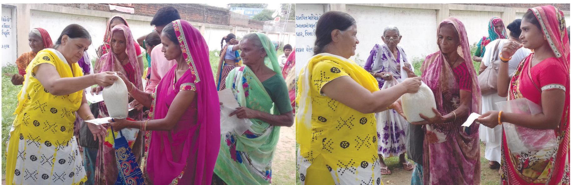
શ્રી ગજાનન સેવા સમિતિ દ્વારા શુક્રવારે દહેગામ તાલુકાના દેવકરણના મુવાડા ખાતે પાંચ ગામોનાં વિધવા બહેનો તથા વૃદ્ધોને ૩ કિલો ચોખાનું વિતરણ કરવામાં આવ્યું હતું. જરૂરિયાતમંદોને છત્રી તથા ચપ્પલની ભેટ પણ ધરવામાં આવી હતી. ભાટાઈ ખાતે પણ ૬ લાભાર્થીઓને આ સેવાનો લાભ આપવામાં આવ્યો હતો.