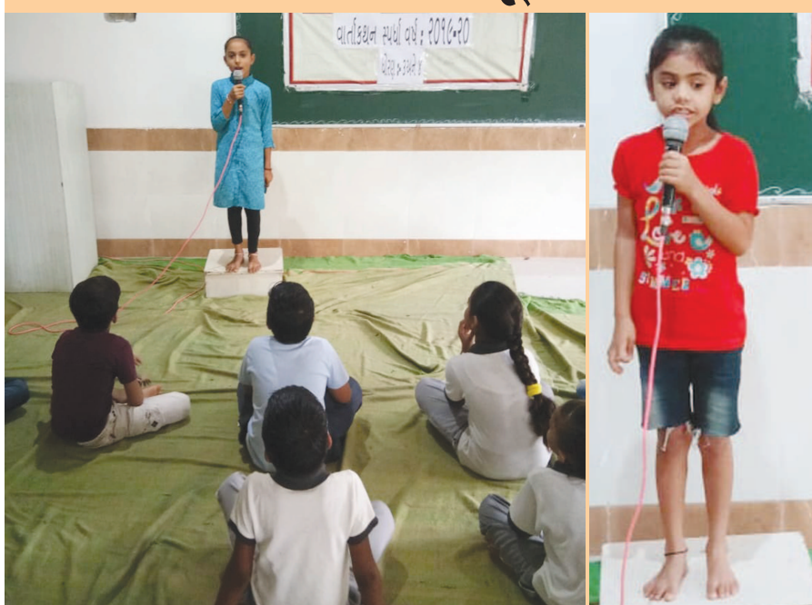
બાળકો નાની વયથી જ મુક્તપણે મોટા સ્ટેજ પર બોલી શકે તે શુભાશયથી ઓમકાર ઇન્ટરનેશનલ સ્કૂલ દ્વારા ધોરણ-૧ થી ૪ના વિદ્યાર્થીઓ માટે વાર્તાકથન સ્પર્ધાનું આયોજન કરવામાં આવ્યું હતું. બાળકોએ આ સ્પર્ધામાં સુંદર વાર્તાઓ આગવી શૈલીમાં પ્રસ્તુત કરી હતી. પ્રથમ ત્રણ ક્રમે વિજેતા થનારા બાળકોને શાળા તરફથી બિરદાવી પ્રમાણપત્રો એનાયત કરવામાં આવ્યાં હતાં.