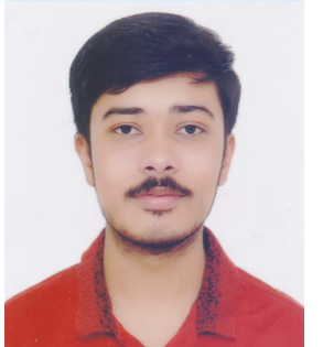
શુભમ એ દવે