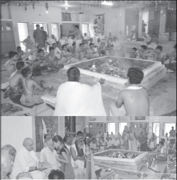
સેક્ટર-૨૮ ખાતે સ્થિત દત્ત મંદિરના પાટોત્સવની ઉજવણી રવિવારે કરવામાં આવી હતી. આ પ્રસંગે નેજસ્વી વિદ્યાર્થીઓને ઈનામો એનાયત કરીને પ્રોત્સાહિત કરવામાં આવ્યા હતા.