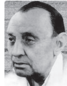
ઉચ્ચ, બજેટાલ મંજૂર રહેલે તે ભવાની મા, એક હરતુને ફરતું મંદિર મારો ગરબો, માડી તારા મંદિરમાં ધંધરવ થાય... વિ. ગરબાએ ગુજરાત અને ગુજરાતી પર સામ્રાજ્ય જમાવી દીધું છે. કવિ શ્રી બોટાદકર પછી શ્રેષ્ઠ કવિ કુંભજીવનના બાળક અવિનાશે, ધોડીયે હિંચોળતા ગાતા એ છે મહાન ગીતકાર અને સંગીતકાર શ્રી અવિનાશ વ્યાસ. અમદાવાદમાં સંસ્કારી નાગરી નાતમાં ૨૧ જુલાઈ, ૧૯૧૧માં જન્મેલા બાળક અવિનાશે, ધોડીયે હિંચોળતા ગાતા મહિષાસુર મર્દિન કંઠે ગવાયેલા હાલરડાં અને ભાવભર્યા ભજનો ગળવુંથી માંડી પીધા હોય તેમ બાળપણથી જ ગાયું તેમને માટે સહજ હતું. ક્રિકેટનો શોખ તેમને મુંબઈ લઈ ગયો પરંતુ ત્યાં ક્રિકેટને બદલે ઉદય થયો ગુજરાતી ગીત સૂરનો. મુંબઈની નેશનલ ગ્રામોફોન કું. સાથે મિલાપ થતાં આ શ્રેણી હમણાં જ પ્રવેશવા જુવાનિયા અવિનાશના ગીતોને રેકોર્ડીંગ થવા લાગ્યું. એટલું જ નહીં એક ઈન્ડિયા રેડિયો પરથી પ્રસારિત પણ વાદ્યા અને પાર્સિયન ગાયોનો આનંદ સાંભળીને કોઈની આંખો ધેરી રહી શકે?

સુધી લંબાવવા માટે રાજ્ય સરકારે આ નિર્ણય કર્યો છે. આ ઉપરાંત છેલ્લા બે વર્ષથી પ્રાથમિક શાળાઓમાં ધોરણ ૮ ચાલુ કરવામાં આવતા મોટી સંખ્યામાં કન્યાઓ અને કુમારો હાલ ધોરણ ૮ સુધી ભણે છે અને ત્યારબાદ માધ્યમિક શાળાઓમાં પણ ભણવા માટે આવતા હોઈ, ચાલુ વર્ષ ધોરણ ૮-૧૦ના એડમીશનમાં મોટો વધારો થવાથી ધોરણ ૮ અને ૧૦ના ૨૦૦૦ નવા વર્ગો મંજૂર