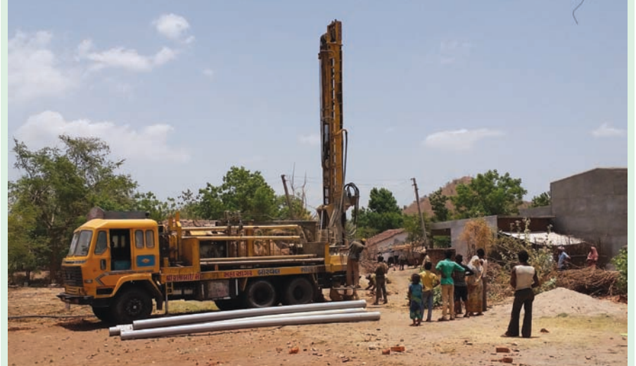
અછત હોય છે તેમજ ગ્રામજનોને પાણી ભરવા માટે દુર દુર સુધી જવું પડતું હોય તેવા ગામોમાં પાણીના બોર બનાવીને ઉત્તમ સેવાનું કાર્ય કર્યું છે. પાણીના નવા બોરને લઈ ગામમાં પાણીની અછત દુર થતા ગામલોકોમાં ખુશીનું મોજુ ફરી વળ્યું હતું. શ્રી ગજાનન સેવા સમિતિ દ્વારા છેલ્લા ૨૦ દિવસમાં ભિલોડા

તાલુકાના ખેરાડી, મેરવાડા ગામમાં ૨ બોર તેમજ મોડાસાના વાંટડા ગામમાં માત્ર ૧૨૦ કુટુંબો પાણી આવી ગયું હતું. ગજાનન સેવા સમિતિ દ્વારા અંતરિયાળ વિસ્તારમાં ઘણા વર્ષોથી ઉનાળામાં પગરખા,