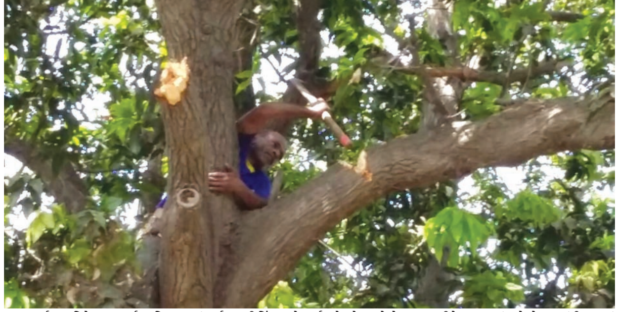
પર્યાવરણ દિને સાદર અર્પણ - વિશ્વભરમાં પર્યાવરણની ચિંતા અને ચર્ચા ચારેયકોર ચાલે છે... ખાસ કરીને ગુજરાતમાં અને એમાય ગાંધીનગરમાં પર્યાવરણ માટે નાગરિકોમાં સતત જાગૃતિ વર્તાય છે, આમ છતાં વૃક્ષ કાપવાની પ્રવૃત્તિ હજુ અટકતી નથી... કોણ આંખ આડા કરે છે હજુ સમજાતું નથી... કોના ઈશારાથી વૃક્ષો કપાય છે, કોણ કાપે છે, અને શાના માટે કાપે છે...? આ બધા જ પ્રશ્નો પર્યાવરણ દિનની પ્રભાતે મુંઝવે છે... ગાંધીનગરના હાર્ટસમા સેક્ટર-૦ની આ તસવીર પ્રશ્નો ઉભા પાણ કરે છે અને જવાબ પણ આપે છે....

અટકળોનો અંત આવી ગયો હતો. આજે સવારે ભારે રાજકીય અટકળબાજી વચ્ચે ખડસે મુખ્યપ્રધાન દેવેન્દ્ર ફડનવીસને મળ્યા હતા. તેમની સાથે વાતચીત કર્યા બાદ ખડસેએ રાજનામુ આપ્યું હતું. મળેલી માહિતી મુજબ મોટી સરકાર બન્યા બાદ ભ્રષ્ટાચારના મામલે રાજનામુ આપનાર ખડસે પ્રથમ પ્રધાન બની ગયા છે. ભાજપના નેતા સાર્થના એનસીએ કહ્યું છે કે ખડસેએ નૈતિક જવાબદારી સ્વીકારીને રાજનામુ આપ્યું છે. તેમણે કહ્યું હતું કે ખડસેએ તપાસ પૂર્ણ થાય ત્યાં સુધી હટી જવાનો ફેસલો કર્યો છે. રાજ્યમાં વિપક્ષી પાર્ટી કોંગ્રેસે આ મામલે મોટા દેખાવની જાહેરાત કરી છે. રાજ્ય કોંગ્રેસે ખડસેની સામે એકાઉન્ટ આર દાખલ કર્યા બાદ તેમની ધરપકડ કરવાની માંગ કરી છે. બપોરે આ સંબંધમાં પત્રકાર પરિષદ યોજાશે. વધારે માહિતી આપવામાં આવી હતી. છેલ્લા બે ત્રણ દિવસથી ખડસે રાજનામુ આપી દેશે તેવી માંગ કરવામાં આવી રહી હતી.