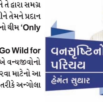
વનસૃષ્ટિનો પરિચય હેમંત ચૌધાર