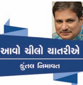
આવો ચીલો ચાતરીએ કુંટલ નિમાવત

સુંદર સ્પર્ધાનો સુંદર સ્પર્ધા માત્ર એટલા માટે જ નહીં કે તેનું આયોજન સારી રીતે થાય છે ને માત્ર એટલા માટે પણ નહીં કે તેમાં ભજવાતાં નાટકોની ગુણવત્તા ઘણી સારી હોય છે. પરંતુ આ સ્પર્ધા એટલા માટે પણ સુંદર કે સ્પર્ધા છે ગુજરાતી નાટકોની ને એનું આયોજન કરનારા મોટાભાગના આયોજકો મહારાષ્ટ્રીયન છે!