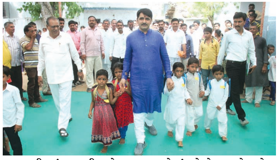
ભાભરની આંગણવાડી અને પ્રા. શાળાઓમાં પ્રવેશોત્સવ યોજાયો

વેકલિક વ્યવસ્થા વિના આમ ટ્રેનોના ડબ્બાની સંખ્યામાં ઘટાડો કરવામાં આવતા અડધી ટ્રેન માત્ર આવતી જતી હોય છે. સાબરકાંઠાના તલોદ તાલુકાના એસટીની કોઈ જ યોગ્ય સુવિધા ઉપલબ્ધ નહી હોઈ અબાલવુદ્ધ મુસાફરો તથા મહિલા મુસાફરોનું હાલ હડકડોટ ભીડમાં નકર્યું જોખમી મુસાફરી કરવા મજબુર બનવાની નોબત આવી પડી છે. કેટલાક મુસાફરો ડબ્બાની ઉપર બેસીને પણ આકરી સફર કાપી રહ્યા છે.