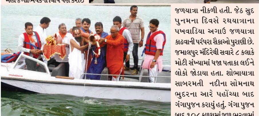
જળયાત્રા નીકળી હતી. જેટ સુદ પુનમના દિવસે રથયાત્રાના પખવાડિયા અગાઉ જળયાત્રા કાઢવાની પરંપરા ચૈકાઓ પુરાણી છે. જમાલપુર મંદિરેથી સવારે ૮ કલાકે મોટી સંખ્યામાં ધજા પતાકા લઈને લોકો જોડાયા હતા. શોભાયાત્રા સાબરમતી નદીના સોમનાથ ભુદરના આરે પહોંચ્યા બાદ ગંગાપુજન કરાયું હતું. ગંગા પુજન બાદ ૧૦૮ કળશમાં જળ ભરવામાં

અમદાવાદ, તા. ૨૦ જગન્નાથ ગજવેશમાં મોસાળ પ્રસ્થાન કરી ગયા છે. જગન્નાથ મંદિર રથયાત્રા પૂર્વ અતિ મહત્વની રથયાત્રા આરંભ તરીકે ગણતરીના દિવસો બાકી રહ્યા છે ત્યારે આજે ભવ્ય જળયાત્રા કાઢવામાં આવી હતી. જળયાત્રા દર વર્ષે પરંપરાગત રીતે યોજવામાં આવે છે. જેમાં મોટી સંખ્યામાં શ્રદ્ધાળુઓની સાથે સાથે ભજન મંડળીઓ, શણગારેલા હાથીઓ પણ જોડાય છે. મોટી સંખ્યામાં ધજા પતાકા પણ જોવા મળે છે. ગંગા પૂજનની વિધિ કરવામાં આવી હતી. નિજ મંદિરે આવ્યા બાદ સવારે મહાજળાભિષેકની વિધિ પણ કરાઈ