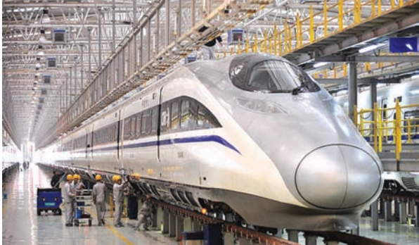
નવી દિલ્હી, તા. ૨૦

વારાણસીથી દિલ્હીના ૭૮૨ કિલોમીટરના અંતરને પૂર્ણ કરવામાં ૧૨ કલાકનો સમય લાગે છે : બુલેટ ટ્રેનથી ૭૦ કલાક-૪૦ મિનિટનો સમય