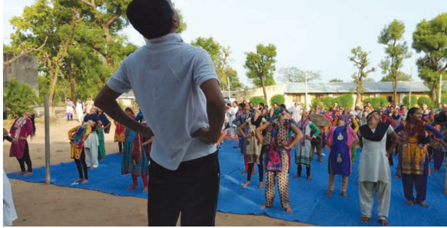
૨૧મીએ વિશ્વ યોગ દિવસની થનારી ઉજવણી માટેની જિલ્લાભરમાં તેયારી ચાલી રહી છે. કલોલ તાલુકાના નારદીપુર ખાતે તાલુકા કક્ષાના યોગ દિવસની ઉજવણીમાં ભાગ લેવા બાળકોને તાલિમ આપવાના વિશેષ વર્ગ ચાલી રહ્યા છે તેની તસવીર.

એચ ટાટ (મુખ્ય શિક્ષક) ઉમેદવારોની જિલ્લા પસંદગી પ્રક્રિયા હાથ ધરાઈ હતી. પરંતુ કોઈ કારણોસર સ્થળ પસંદગી પ્રક્રિયા મોકુફ રાખવામાં આવતા જે તે પસંદગી પામેલા ઉમેદવારો સ્થળ પસંદગીની રાહ જોતા છેલ્લા ત્રણ માસથી નોકરીમાંથી છુટા કરાતા બેકાર બનેલા છે. નવા સત્રથી ખાનગી શાળાઓ ખાતે નોકરી કરતા ઉમેદવારોના પરિવારની આર્થિક સ્થિતિ મુશ્કેલીમાં છે. તેમજ આ પ્રક્રિયા ક્યારે પૂર્ણ થશે તેની રાહ જોતા ઉમેદવારો અસમજસમાં પડ્યા છે. ત્યારે જિલ્લા પસંદગી પામેલ ઉમેદવારોએ નાયબ મુખ્યમંત્રીને આવેદનપત્ર આપી યોગ્ય કરવા રજૂઆત કરી છે.