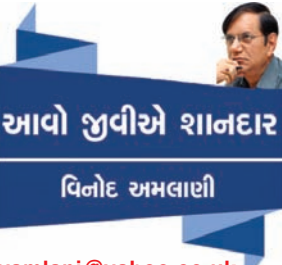
આવો જુવીએ શાનદાર

વ્યક્તિઓમાં એ શક્તિ સોળે કળાએ મ્હોરી ઊઠે છે અને બાલ્યવાનની જેમ ખીલી ઊઠે છે. વ્યક્તિમાં પડેલી સુષુપ્ત સર્જનાત્મક શક્તિને જો યોગ્ય સમયે ઓળખીને તેને જાણી-પિછાણી અને ખિલાવવા માટે પ્રયત્ન કરવામાં આવે તો એ શક્તિ કસમયે મૂરજાવને બદલે પૂરી રીતે ઊગીને નીકળી શકે અને ક્ષિતિજોની પેલે પાર સુધી વિસ્તારી અને વિકસી શકે છે.