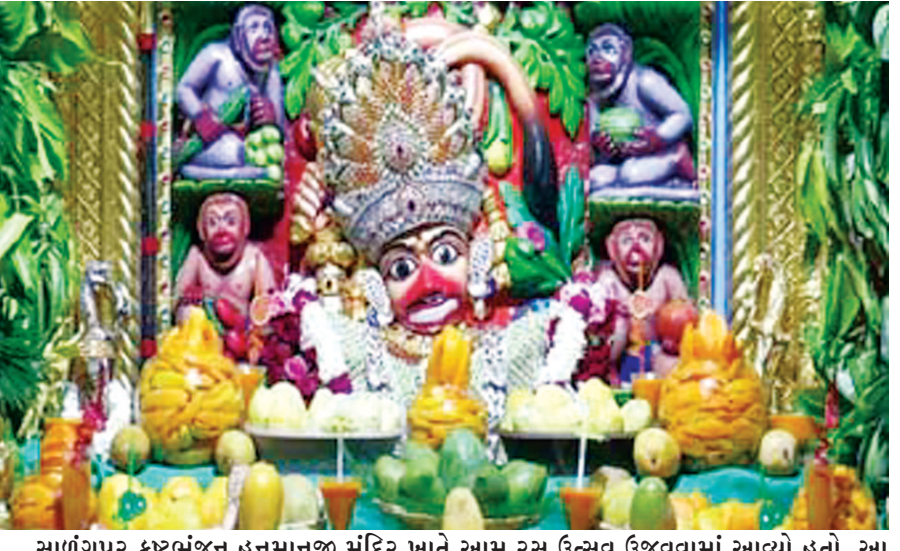
સાળંગપુર કબ્રદાજન હનુમાનજી મંદિર ખાતે આમ રસ ઉત્સવ ઉજવવામાં આવ્યો હતો. આ પ્રસંગે હનુમાનજીનો કેરીથી ભવ્ય શણગાર કરાયો હતો. ઉલ્લેખનીય છે કે બોટાદના સાળંગપુર હનુમાનજી મંદિર ખાતે અલગ-અલગ તહેવાર નિમિત્તે અલગ અલગ શણગાર સાથે હનુમાનજીનો શણગાર કરવામાં આવે છે. હાલ ઉનાળાની સીઝન હોઈ ફળોના રાજા એવી અલગ-અલગ પ્રાંતની કેરી સાથે કેરીના રસ, કેરીની કટકી સાથે હનુમાનજીનો કેરીથી શણગાર કરવામાં આવ્યા છે.