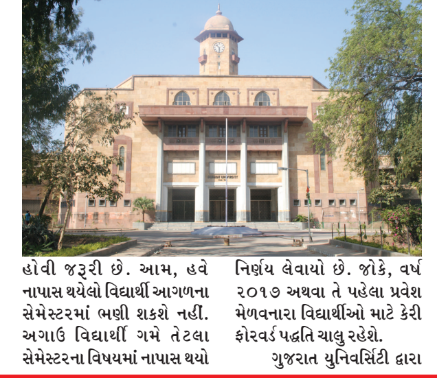
હોવી જરૂરી છે. આમ, હવે નાપાસ થયેલો વિદ્યાર્થી આગળના સેમેસ્ટરમાં ભણી શકશે નહીં. અગાઉ વિદ્યાર્થી ગમે તેટલા સેમેસ્ટરના વિષયમાં નાપાસ થયો હોય તો પણ તેને આગળના સેમેસ્ટરમાં જવા દેવામાં આવતો હતો. આમ, જૂન-૨૦૧૮થી નવા પ્રવેશ મેળવનારા વિદ્યાર્થીઓ માટે કેરી ફોર્વર્ડ પદ્ધતિ રદ કરવાનો

વિદ્યાર્થીઓને મળશે નહીં.. ગુજરાત યુનિવર્સિટીની એકેડેમિક કાઉન્સિલની બેઠકમાં લેવામાં આવેલા નિર્ણય પ્રમાણે જૂન-૨૦૧૮થી B.A., B.Com., BSC, BBA, B.A., B.C.Ed., M.A., M.Com., M.Sc., M.Ed.ના પ્રથમ સેમેસ્ટરમાં પ્રવેશ મેળવનારા વિદ્યાર્થીઓ માટે કેરી ફોર્વર્ડ સિસ્ટમ બંધ કરવામાં આવી છે. જેથી આ વિદ્યાર્થીઓને કેરી ફોર્વર્ડ સિસ્ટમનો લાભ મળશે નહીં. સ્નાતક કક્ષાએ જૂન-૨૦૧૮માં પ્રવેશ મેળવનારા વિદ્યાર્થીઓ સેમેસ્ટર-૧ની તમામ પરીક્ષાઓ પાસ કરી હોય તેવા જ વિદ્યાર્થીઓને સેમેસ્ટર-૨માં પ્રવેશ મળશે.