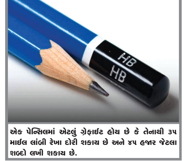
એક પેન્સિલમાં એટલું ગ્રેફાઈટ હોય છે કે તેનાથી ૩૫ માઈલ લાંબી રેખા દોરી શકાય છે અને ૪૫ હજાર જેટલા શબ્દો લખી શકાય છે.