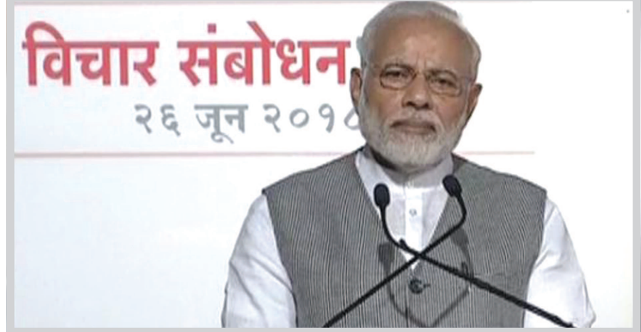
વિચાર સંબોધન ૨૬ જૂન ૨૦૧૮

પીએમ મોદીએ ટ્વિટ કરીને ઈમરજન્સીને લઈ કોંગ્રેસ પર કચા આકરા પ્રહાર : કટોકટીના ૪૩ વર્ષ પૂર્ણ: લોકતંત્રને સચેત રાખવા માટે ઈમરજન્સીને યાદ કરવુ જરૂરી, પરિવાર માટે બંધારણનો દૂરપયોગ કરવામાં આવ્યો