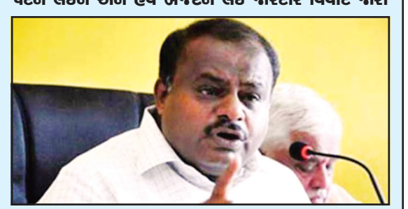
બેંગલોર, તા. ૨૬

અસંતુષ્ટ કોંગ્રેસી નેતા ભાજપના સંપર્કમાં આવ્યા : પહેલા મંત્રીમંડળમાં સંખ્યાને લઇને, ત્યારબાદ કેબિનેટમાં પદને લઇને અને હવે બજેટને લઈ જોરદાર વિવાદ જારી