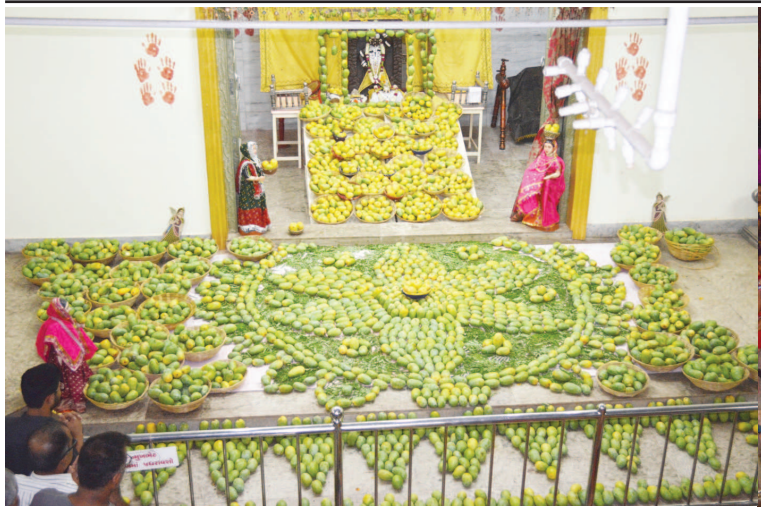
શ્રીજી શ્રી ગોવર્ધનનાથજીની હવેલી ખાતે કેરી મહોત્સવ યોજાયો

ગાંધીનગર, તા. ૧૩ ગુજરાતના દરિયાકિનારે 'વાયુ' વાવાઝોડાનું સંકટ તોળાયું છે અને તેની અસર સમગ્ર સૌરાષ્ટ્ર અને કચ્છના વિસ્તારમાં વર્તાઈ રહી છે ત્યારે શહેરનો આ અંગે ચિંતામાં જણાઈ રહ્યા હતા. જો કે વાવાઝોડાની કોઈ વધુ અસર ગાંધીનગરમાં થવાની જ ન હતી છતાં શહેરમાં તંત્રને એલર્ટ મોડ પર મુકવામાં આવ્યું હતું. સરકારી ઓફિસો, પાનના ગલ્લા, ચાની લારી, ગાર્ડન, લાયબ્રેરી, ઓફિસો, જાહેર સ્થળો તથા દરેક ઘરમાં વાયુ વિશે ચર્ચા થતી હતી. જો કે હવે વાયુ એ દિશા બદલતા આક્રમક ટળી છે.