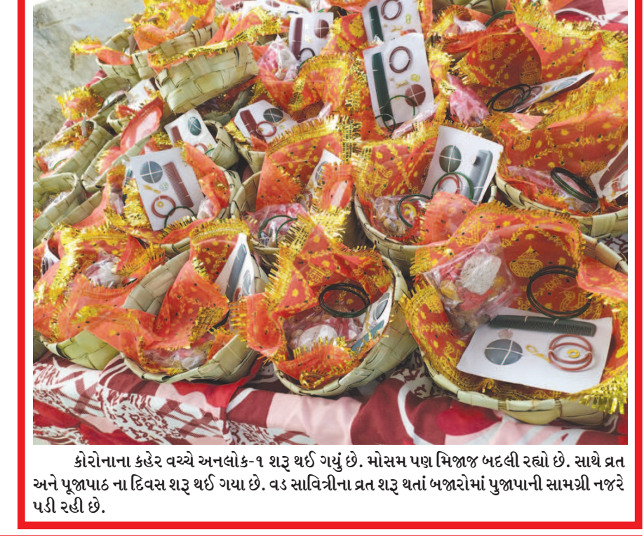
કોરોનાના કહેર વચ્ચે અનલોક-૧ શરૂ થઈ ગયું છે. મોસમ પણ મિજાજ બદલી રહ્યો છે. સાથે ત્રણ અને પૂજાપાઠ ના દિવસ શરૂ થઈ ગયા છે. વડા સચિવ ત્રણ શતોના પ્રતિ રૂબરૂ થતાં બજારોમાં પુજાપાની સામગ્રી નજરે પડી રહી છે.

રાઈવ ટાઈમ સિગ્નલ જનરેશન થી લઈને પ્રોસેસિંગ, ટ્રાન્સમિશન વિષે માહિતગાર કરવાનો