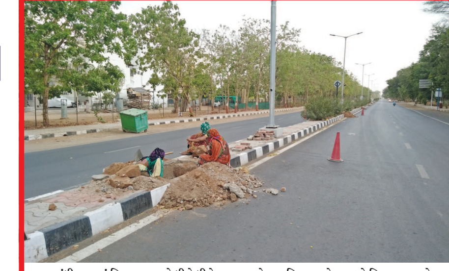
ગાંધીનગરમાં વિકાસના કામો ધીમે ધીમે શરૂ થયા છે. સ્થાનિક મજૂરો મારફતે વિકાસના કામો શરૂ કરવામાં આવ્યા છે. ગ-૨ થી ગ-૩ના માર્ગ ઉપર નવા થાંભલા નાંખવાનું કામ શરૂ થઈ ચુક્યું છે. વરસાદ પહેલાં આ કામ પૂર્ણ થાય તેનું તંત્રનું આયોજન છે.