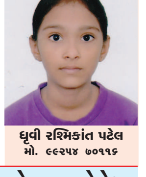
જ્યોતિબેન ૬૬૬૨ લાચોનેસ કલબ