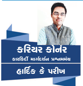
કરિયર કોનર હાર્દિક કે પરીખ

સેવાઓ માટે પ્રતિબદ્ધતાની તીવ્ર સમજની જરૂર છે. તે આગના પ્રકોપથી તમામ જીવંત પ્રાણીઓ અને ઈમારતોની સુરક્ષા સાથે સંબંધિત છે. ફાયર એન્જિનિયરને બને તેટલી ઝડપથી બદલાવને અનુકૂળ થવું પડે છે. ફાયર એન્જિનિયરિંગમાં વ્યક્તિને આપાતકાલીન ક્ષેત્રમાં કેવી રીતે કામ કરવું, ઝડપી નિષ્ણૃત્વ કેવી રીતે લેવા અને સલામતી માપદંડ પૂરા પાડીને અને જીવનધોરણના જેમ કે જરૂરી ઊંચાઈ, વજન, છાતી પછા જરૂરી પાસું જે આપે ધ્યાન રાખવા લાયક બાબત છે. વધુ જાણકારી માટે આપ અમને વોટ્સએપ અથવા ઈમેલ કરી શકો છો. ઓલ ધ બેસ્ટ!