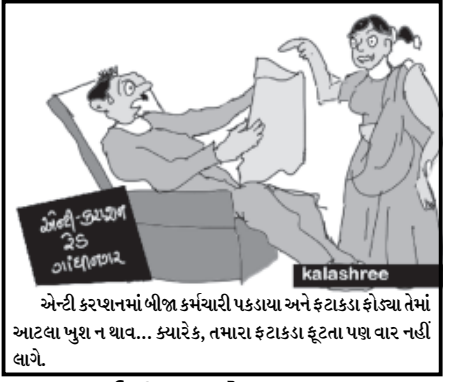
એન્ટી કરણનામાં બીજા કર્મચારી પકડાયા અને ફટકાકા ફોજવા તેમાં આટલા પુશન ન થાવ... ક્યારેક, તમારા ફટકાકા ફૂટતા પણ વાર નહીં લાગે.

ગાંધીનગર, તા. ૨૮ ગૌરવશાળી ઈતિહાસ તરફ નજર નાખવામાં આવે તો ગુજરાતની ખમ્બેલીવંતી પ્રજાએ ગુજરાતી ભાષાને માતૃભાષા સ્થાન પ્રદાન કરી તેના જતન અને સંરક્ષણ માટે યથોચિત ઉપાયો પ્રયોજવા માહુમ્ પડે છે. આ માતૃભાષા વર્તમાન સમયમાં વિદેશી ભાષાઓના અભિભાવના પરિણામે ધીમે ધીમે ગુજરાતની પ્રજાના મોટા ભાગના કાર્યક્રમોમાંથી જાણે અજાણ્યાનો અહેસાસ કરી રહી છે. સાથે સાથે શૈક્ષણિક ક્ષેત્રે અન્ય ભાષાઓના વધતાં પ્રભુત્વની ગૂંચળામણ અનુભવી રહી છે. આ માતૃભાષા પ્રત્યે આધુનિક પેઢી મનવલ કેળવે અને તેના મહત્વને ધિણણે તે માટે માતૃભાષા ગૌરવદિન પ્રસંગે શાળામાં વિવિધ સ્પર્ધાઓ તથા કાર્યક્રમોનું આયોજન કરવામાં આવ્યું હતું. આ પ્રસંગે કેમ્પસ સ્થિત ભગિની સંસ્થા ઉમા આર્ટ્સ અને નાથીબા કોમર્સ ગૌરવશાળી ઈતિહાસ તરફ નજર નાખવામાં આવે તો ગુજરાતની ખમ્બેલીવંતી પ્રજાએ ગુજરાતી ભાષાને માતૃભાષા સ્થાન પ્રદાન કરી તેના જતન અને સંરક્ષણ માટે યથોચિત ઉપાયો પ્રયોજવા માહુમ્ પડે છે. આ માતૃભાષા વર્તમાન સમયમાં વિદેશી ભાષાઓના અભિભાવના પરિણામે ધીમે ધીમે ગુજરાતની પ્રજાના મોટા ભાગના કાર્યક્રમોમાંથી જાણે અજાણ્યાનો અહેસાસ કરી રહી છે. સાથે સાથે શૈક્ષણિક ક્ષેત્રે અન્ય ભાષાઓના વધતાં પ્રભુત્વની ગૂંચળામણ અનુભવી રહી છે. આ માતૃભાષા પ્રત્યે આધુનિક પેઢી મનવલ કેળવે અને તેના મહત્વને ધિણણે તે માટે માતૃભાષા ગૌરવદિન પ્રસંગે શાળામાં વિવિધ સ્પર્ધાઓ તથા કાર્યક્રમોનું આયોજન કરવામાં આવ્યું હતું. આ પ્રસંગે કેમ્પસ સ્થિત ભગિની સંસ્થા ઉમા આર્ટ્સ અને નાથીબા કોમર્સ