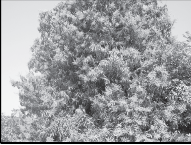
શ્રદ્ધાળુ પ્રમાણે મોસમની સાથે પ્રકૃતિ પણ રંગ બદલે છે. પ્રસ્તુત તસવીરમાં આંબાના વૃક્ષને આવેલા 'મોર'થી આખો આંબો ખીલી ઉઠ્યો છે. મોર આવે તે શ્રદ્ધાળુ પ્રમાણે સ્વાભાવિક છે. મોર અને તેની મોસમ આવતા, મોરને જોતા જાણે એવું લાગે છે કે દર વર્ષે કરતા આ વર્ષે દેશી કેરીનો પાક સારો મળશે તેવું દેશી આંબા ઉપરથી જોઈ શકાય છે. (સંજય શાવલ, પ્રતિજ્ઞા)