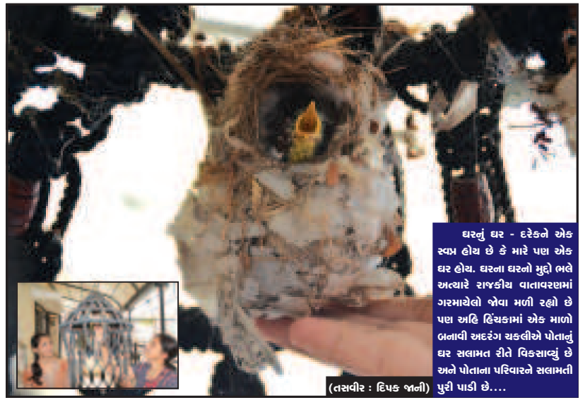
ઘરનું ઘર - દરેકનો એક સ્વપ્ન હોય છે કે મારે પણ એક ઘર હોય. ઘરના ઘરનો મુદ્દો ભલે અત્યારે રાજકીય વાતાવરણમાં ગરમાયેલો જોવા મળી રહ્યો છે પણ અહિં દિલ્હીમાં એક માલો બનાવી અદરંગ થઈ હોય પોતાનું ઘર સલામત રીતે વિકસાવ્યું છે અને પોતાના પરિવારને સલામતી પુરી પાડી છે...