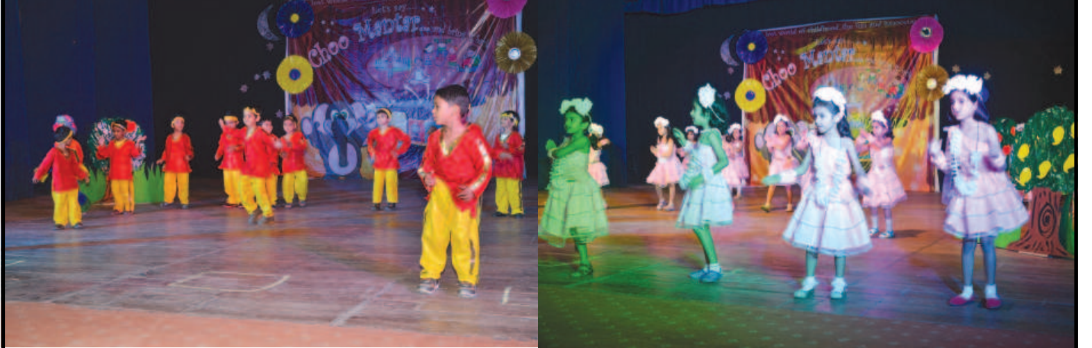
અભિવ્યક્તિ - ગાંધીનગરના પાદરમાં આરંભાયેલ પોદાર ઈન્ટરનેશનલ સ્કૂલનો વાર્ષિકોત્સવ ભારે દબદબાપૂર્વક ટાઉનહોલમાં યોજાયો હતો. શાળાના બાળકોએ રંગબેરંગી વસ્ત્રો પરિધાન કરી ભારતીય સંસ્કૃતિને ઉજાગર કરતી એક એકથી ચડિયાતી કૃતિઓ રજૂ કરી હતી. આંતરશક્તિના વિકાસ માટે સાંસ્કૃતિક પ્રવૃત્તિઓની અભિવ્યક્તિ વિદ્યાર્થીના સર્વાંગી વિકાસ તરફનું પ્રથમ અને મહત્વનું પગલું છે... પોદાર સ્કૂલના બાળકોએ સુંદર કાર્યક્રમ રજૂ કરી શિક્ષકો, વાલીઓ અને આમંત્રિતોને મંત્રમુગ્ધ કર્યા હતા...

ગુજરાત સમૃદ્ધ બનતું જાય છે અને તે સરકારના કારણે... સરકારે તેના ઓફિસિયલ ડેક્યુમેન્ટમાં જાહેર કર્યું છે કે ગુજરાતના નાગરિકો સમૃદ્ધ બનતા જાય છે. આંકડા જોઈને આનંદ થાય