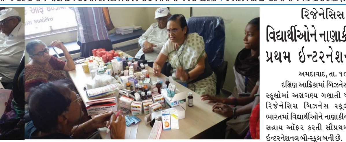
આંતરરાષ્ટ્રીય મહિલા દિવસની ઉજવણી નિમિત્તે ગજાનન સેવા સમિતિ દ્વારા સ્ટેટ બેન્ક ઓફ ઈન્ડિયાના સહયોગથી મહિલાઓ માટે ચિકિત્સા શિબિરનું આયોજન કરવામાં આવ્યું હતું. દહેગામ તાલુકાના દેવકરણના મુવાડા, શિયાવાડા પેટા કેન્દ્ર ખાતે સ્થાનિક મહિલાઓ માટે આ શિબિર યોજવામાં આવ્યો હતો. કુલ ૧૦૭ જેટલાં મહિલાઓને તપાસી ત્યાં જ દવા આપવામાં આવી હતી. ગાંધીનગરનાં

ભારતીય સ્ટેટ બેન્ક દ્વારા અખિલ ભારતીય સામાજિક સ્વાસ્થ્ય સંઘ, ગાંધીનગર જિલ્લા એકમના ઉપક્રમે વિશ્વ મહિલા દિવસની ઉજવણી હાથ ધરવામાં આવી હતી. સ્વાસ્થ્ય સંઘનાં સભ્ય મહિલાઓએ આ કાર્યક્રમમાં ઉપસ્થિત રહીને વિવિધ બેન્કિંગ સેવાઓ અંગેની માહિતી પ્રાપ્ત રી હતી, જે બેન્કના અધિકારીઓ દ્વારા આપવામાં આવી હતી. કાર્યક્રમ બાદ મેડિકલ ચેક-અપ કેમ્પનું આયોજન પણ કરવામાં આવ્યું હતું, જેનો લાભ સંસ્થાનાં સભ્ય બહેનો ઉપરાંત સ્થાનિક મહિલાઓએ પણ લીધો હતો.