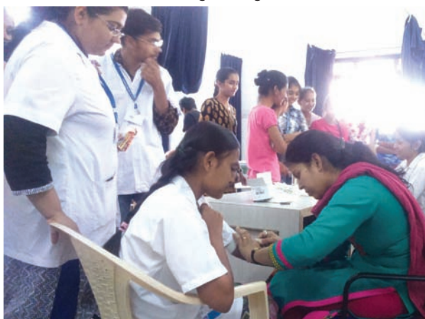
ગાંધીનગર સિવિલ હોસ્પિટલ કંપાઉન્ડમાં કાર્યરત સી એમ પટેલ નર્સિંગ કોલેજ તેમજ સી એમ પટેલ ફિઝીયોથેરાપી કોલેજમાં થેલેસેમિયાનો કેમ્પ યોજવામાં આવ્યો હતો. કુલ ૧૧૮ વિદ્યાર્થી, વિદ્યાર્થીનીઓએ આ કેમ્પમાં