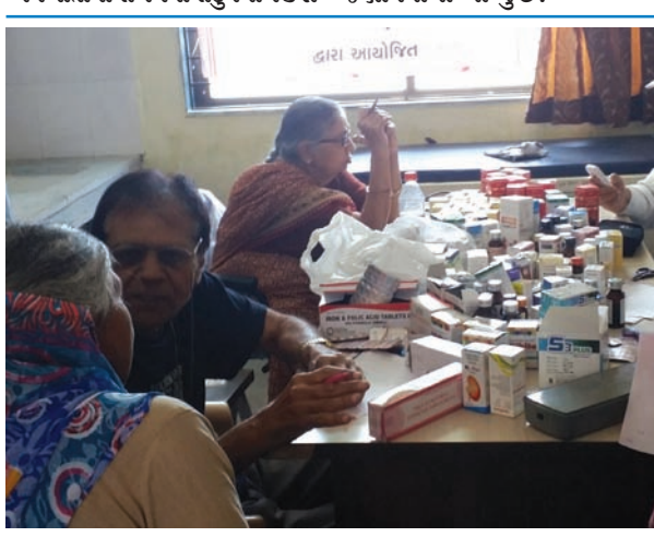
આંતરરાષ્ટ્રીય મહિલા દિવસની ઉજવણી નિમિત્તે ગજાનન સેવા સમિતિ દ્વારા સ્ટેટ બેન્ક ઓફ ઈન્ડિયાના સહયોગથી મહિલાઓ માટે ચિકિત્સા શિબિરનું આયોજન કરવામાં આવ્યું હતું. દહેગામ તાલુકાના દેવકરણના મુવાડા, શિયાવાડા પેટા કેન્દ્ર ખાતે સ્થાનિક મહિલાઓ માટે આ શિબિર યોજવામાં આવ્યો હતો. કુલ ૧૦૭ જેટલાં મહિલાઓને તપાસી ત્યાં જ દવા આપવામાં આવી હતી. ગાંધીનગરનાં

ગાંધીનગર, તા. ૧૦ ગાંધીનગર જીમખાના, સેક્ટર-૧૮નો સ્વિમિંગ પુલ આગામી તા. ૧૮મીથી કાર્યરત થઈ રહ્યો છે. આ કારણે વેકેશનના સમયમાં હવે રેગ્યુલર તથા શિબાઉ સ્વિમર્સ સ્વિમિંગ પુલનો લાભ લઈ શકશે અને પોતાના સમયનો સુદુપયોગ કરી શકશે. સ્વિમિંગ પુલ ખાતે રેગ્યુલર તથા શિબાઉ બેચ સવારે અને સાંજે ચલાવવાનું આયોજન કરવામાં આવ્યું છે, જે માટેનાં નિયત ફોર્મ જીમખાનાની ઓફિસ ખાતેથી મળી શકશે એમ જીમખાના મેનેજરની એક અખબારી યાદીમાં જણાવવામાં આવ્યું છે.