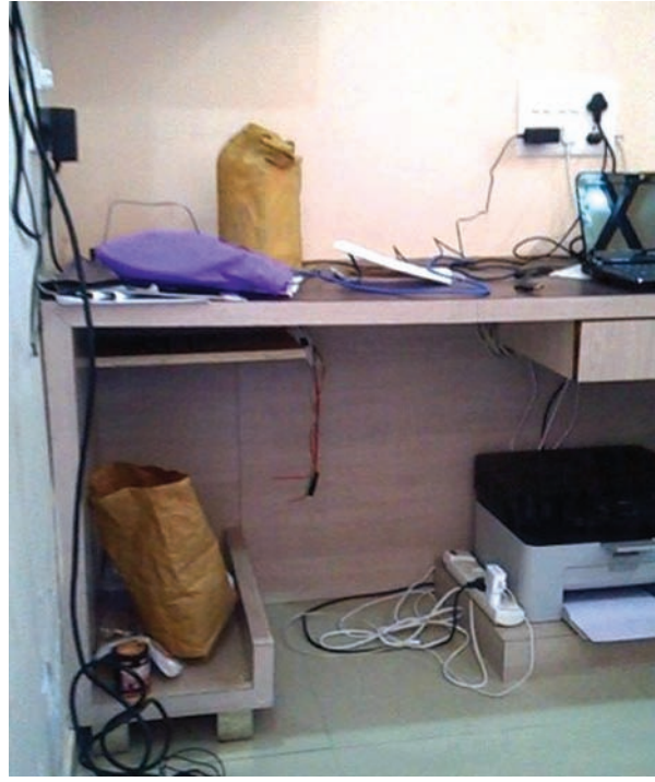
પ્રમુખ ઈલાઈટ કોમ્પલેક્ષની એક દુકાનમાં તસ્કરો ગ્રાટકયા હતા. રાત્રે જો મોડસ ઓપરેટીથી બારી તોડીને વખતે દુકાનમાંથી લેપટોપ, ડીવીઆર, વાઈફાઈ આઉટર અને ૧૫ હજાર રોકડા મળીને કુલ રૂ. ૬૨

હજારનો મુદ્દામાલ ચોરી જવા પામ્યો હોવાનું દુકાન માલિકનું કહેવું છે. જો કે મોડી સાંજ સુધી ચિલોડા પોલીસે ઘરફોડ ચોરીનો ગુનો દાખલ કર્યો ન હતો.