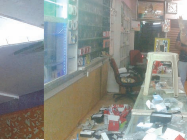
થરાની મોબાઈલ શોપમાં તસ્કરોનો હાથ ફેરો