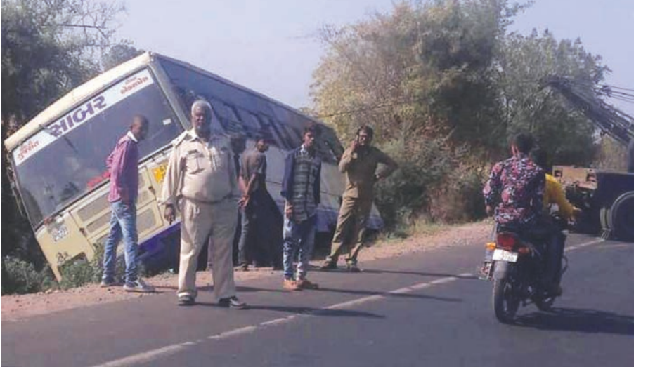
મોડાસા-ધનસુરા માર્ગ પર એસટી બસ ખાડામાં ખાબકી

મળતી માહિતી મુજબ, ટ્રેક્ટરમાં ૫૦ લોકો સવાર હતાં. ટ્રેક્ટર કુવામાં ખાબકતા લગભગ ૨૦ જેટલા લોકો હેમખેમ બહાર આવી ગયા હતા. જ્યારે કુવામાં ફસાયેલા ૩૦ લોકોને બહાર કાઢવાની કામગીરી હાથ ધરવામાં આવી છે. સ્થાનિક લોકો અને ફાયર ફાયટરની મદદથી કુવામાં પડેલા લોકોને બહાર કાઢવા માટે રેસ્કય ચાલુ છે. હાલ કુવામાંથી સાત લોકોની લાશ મળી આવી છે. જ્યારે એકનું સારવાર દરમિયાન મોત નિપજ્યું છે. જ્યારે હજુ કેટલાક લોકો કુવામાં ફસાયેલા હોવાથી બચાવ કામગીરી ચાલુ છે. અકસ્માતના પગલે પંચમહાલના સીપી તથા કલેક્ટર ઘટનાસ્થળે દોડી આવ્યા છે. ઉપરાંત પોલીસ, ૧૦૮ની પાંચ ટીમો અને ફાયર ફાયટર દ્વારા બચાવ કામગીરી હાથ ધરવામાં આવી છે.