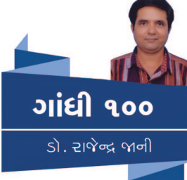
ગાંધી ૧૦૦ ડો. રાજેન્દ્ર વાળી