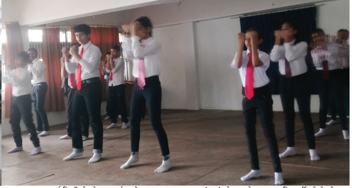
ગાંધીનગર, તા. ૩ એસ.જી.અંગ્રેજી માધ્યમ પ્રાથમિક શાળામાં આવેલ મહત્વની વસ્તુ હોલમાં ધોરણ-૮ વિદ્યાર્થીઓનો વિદાય સમારંભ યોજાયો. આ કાર્યક્રમમાં ધોરણ-૭ના વિદ્યાર્થીઓએ વિવિધ કાર્યક્રમ રજૂ કર્યા હતા. શાળાના આયોજન થયું હતું.